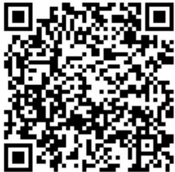
Анкета на вступ до УМПД

Для прийняття нових членів Мережі в якості Асоційованого члена рекомендаційні листи необов'язкові.